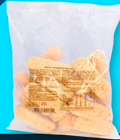
DEDITOS APANADOS MERLUZA COMÚN GAYI CONGELADOS