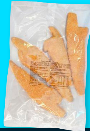
MERLUZA FILETE GAYI NAT APANADA CONGELADO