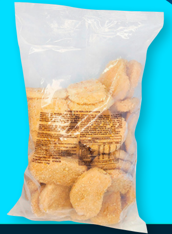
NUGGETS DE MERLUZA GAYI CONGELADO