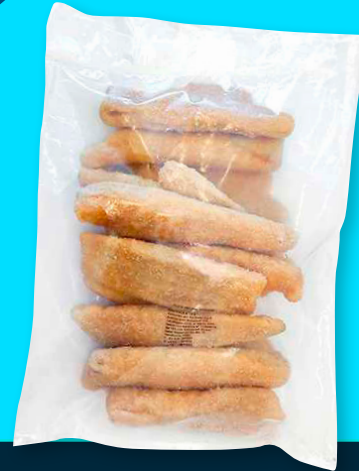
MERLUZA COMÚN FILETE GAYI APANADA CONGELADA